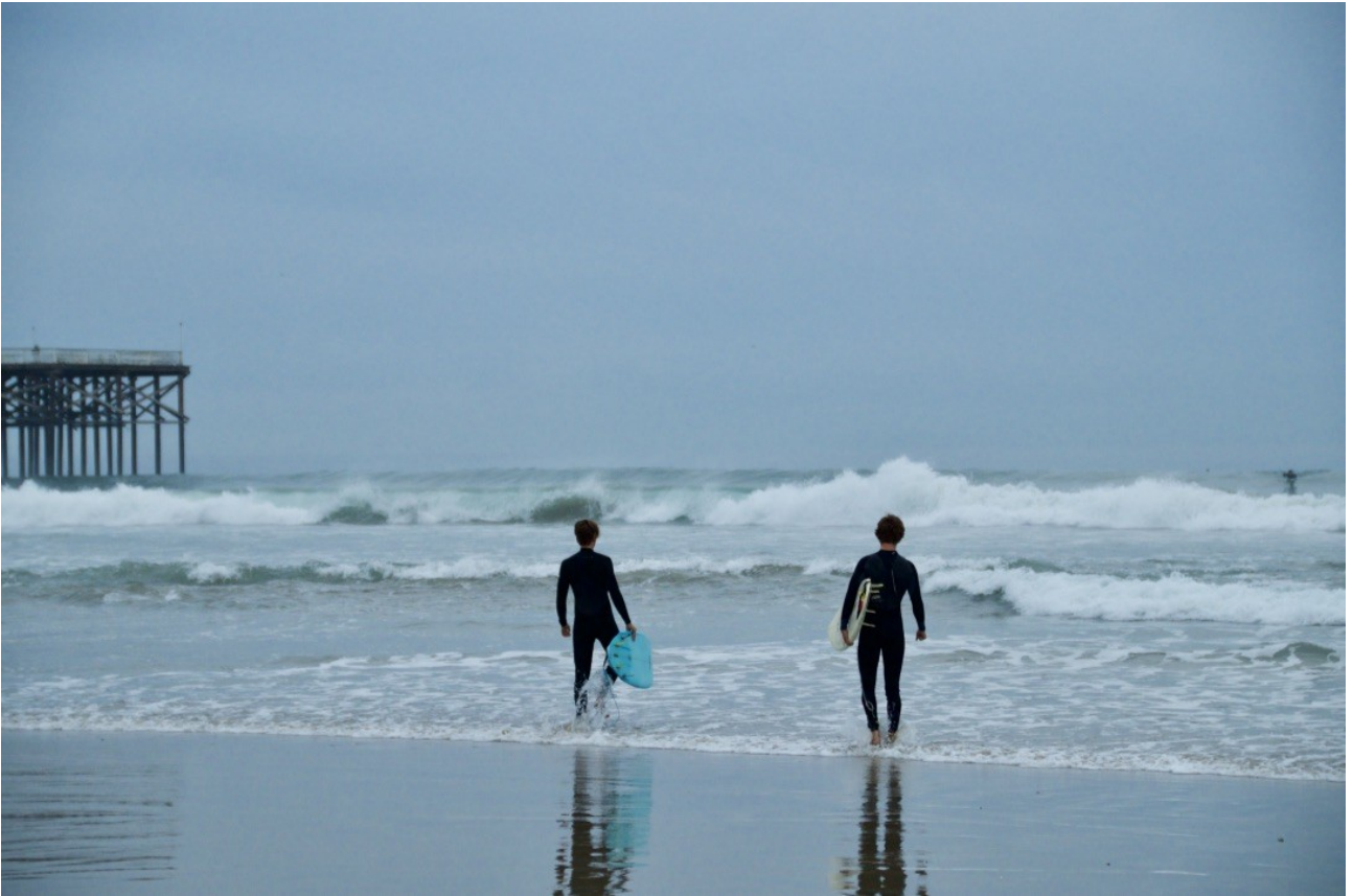
Morgenrutine: stå opp tidlig for å rekke litt surf før skolen. Crystal Pier, Pacific Beach.