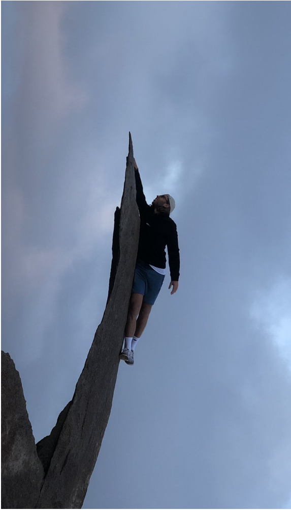
Potato Chip Rock, velkjent hike og turistattraksjon en liten time utenfor San Diego.