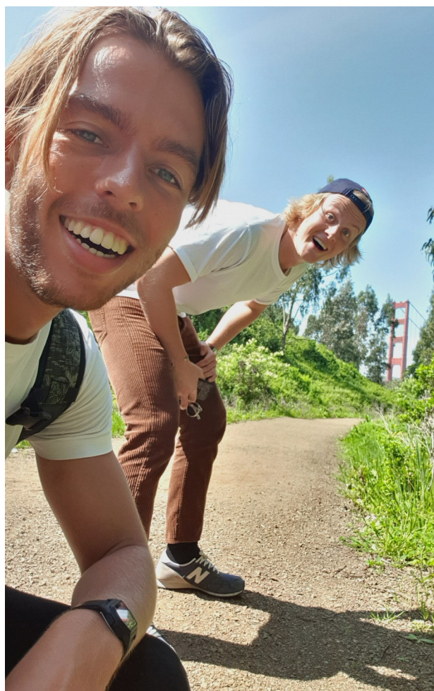
...og et noe mindre klassisk et!