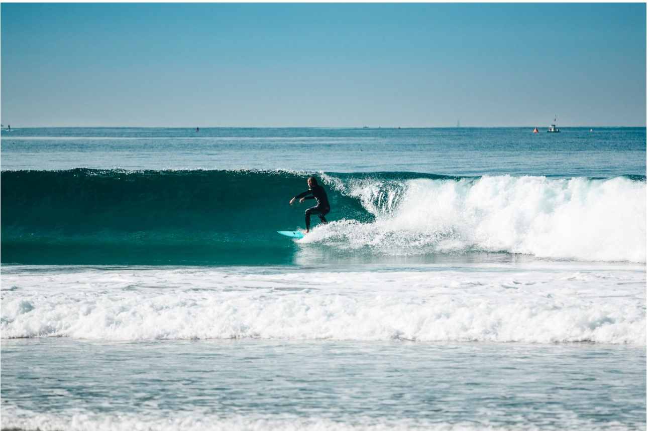
Litt mer surf! Denne gangen på en fredag (og dermed litt senere på dagen). Blacks Beach, La Jolla.