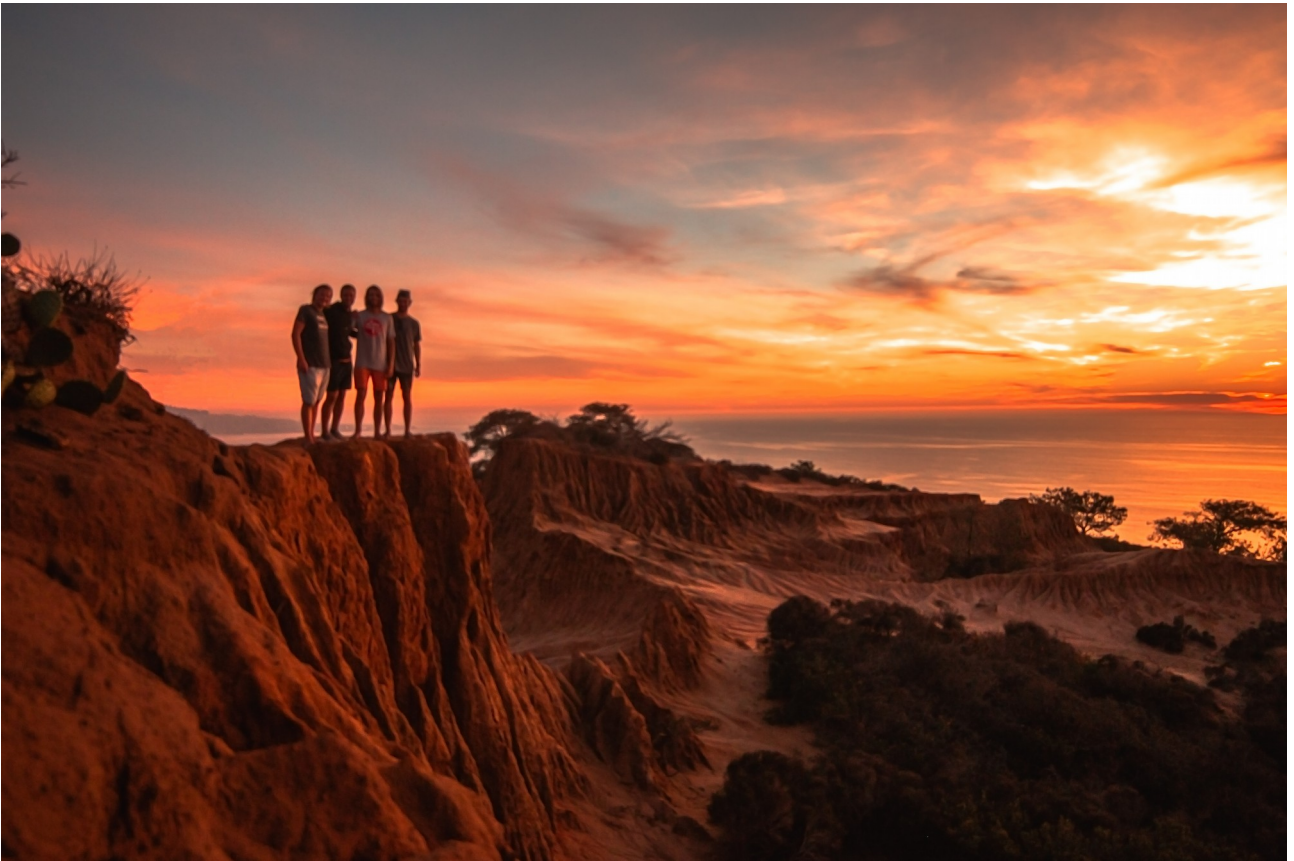
En av mange solnedganger. La Jolla, nærme campus.