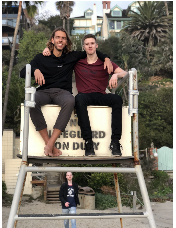
Vi fikk prøvd oss som lifeguards. Laguna Beach, Los Angeles.