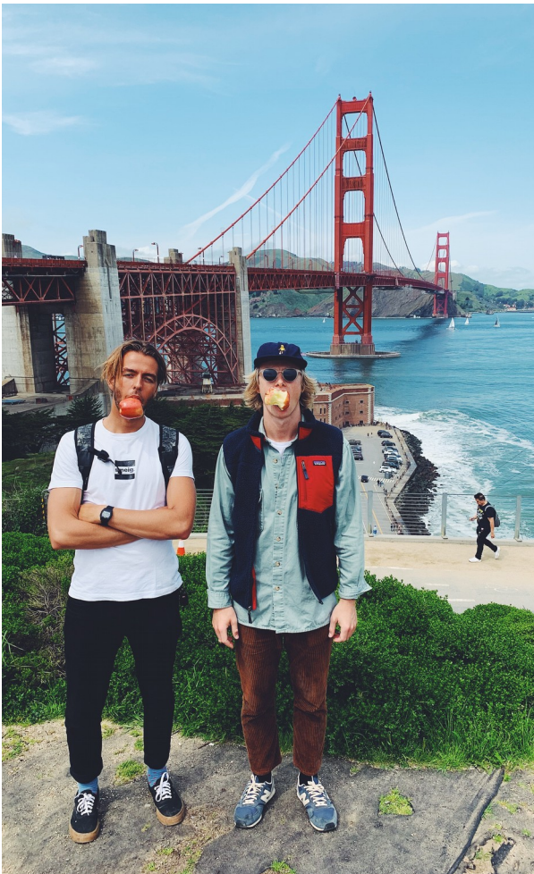
Klassisk turistbilde fra San Fransisco...